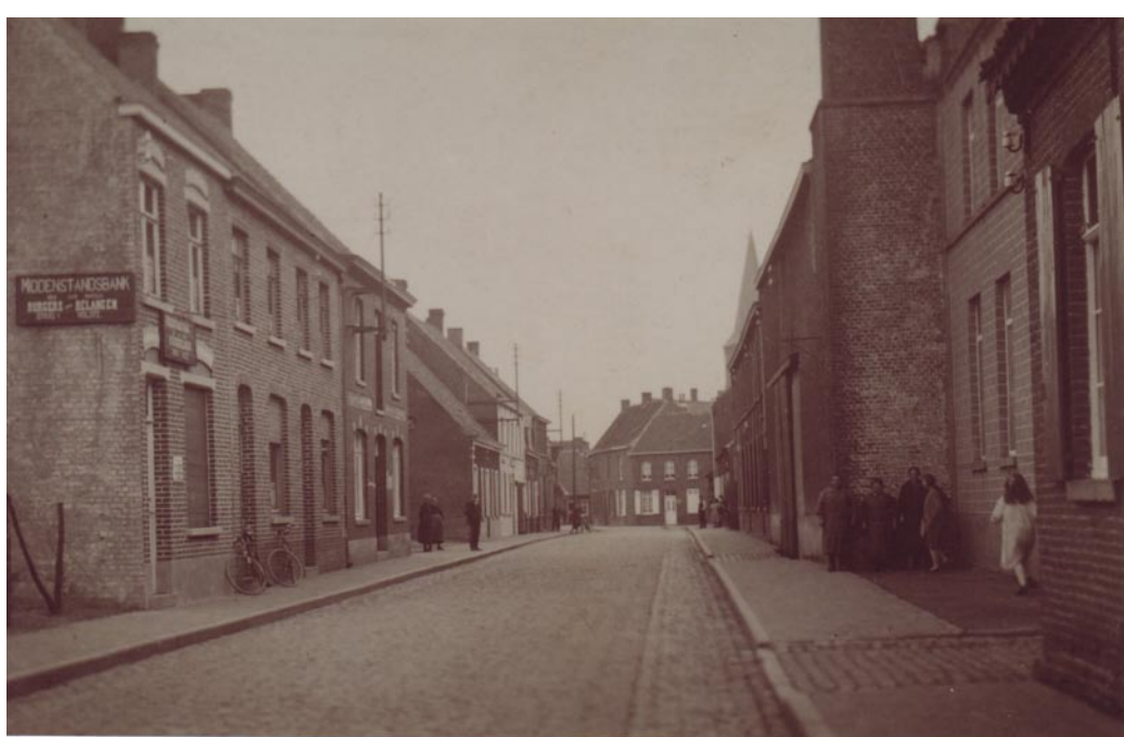
Zicht op de Brugsestraat richting Hulstedorp. De Gareelmakerij/HetSportpaleis zie je aan de linkerkant vóór de drie mensen.