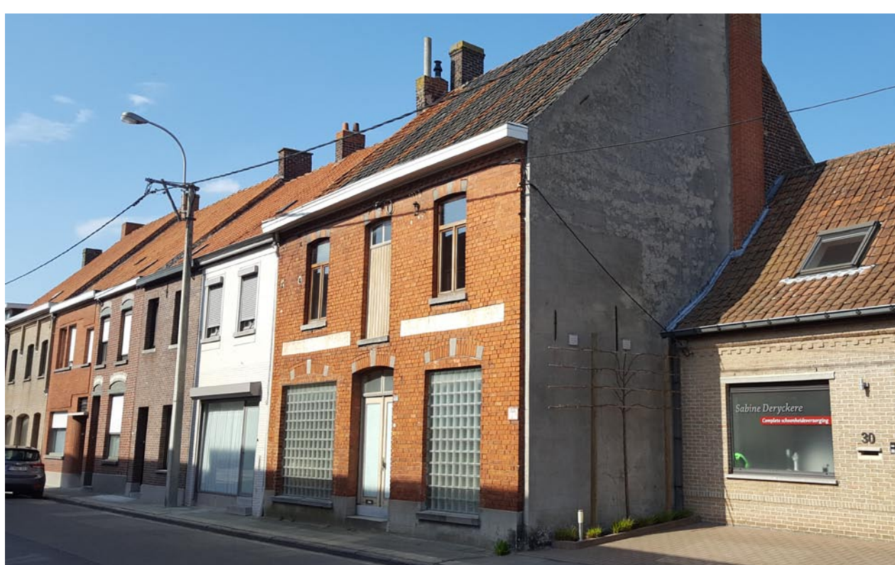
Situatie in 2017